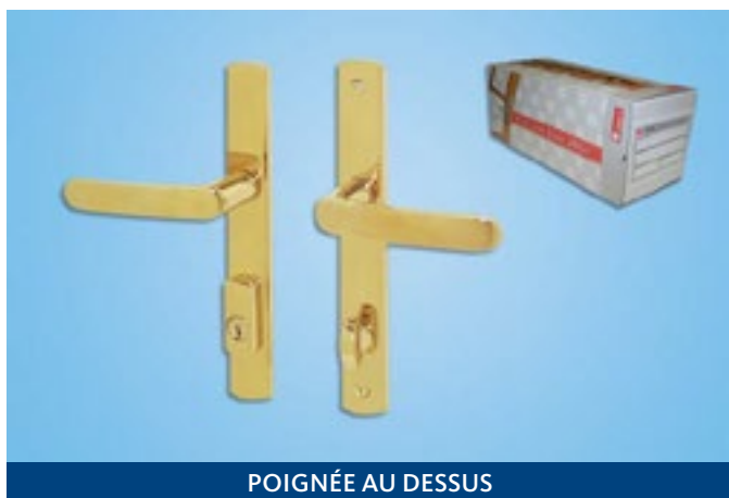
POIGNÉE AU DESSUS