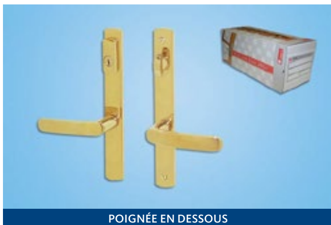
POIGNÉE EN DESSOUS